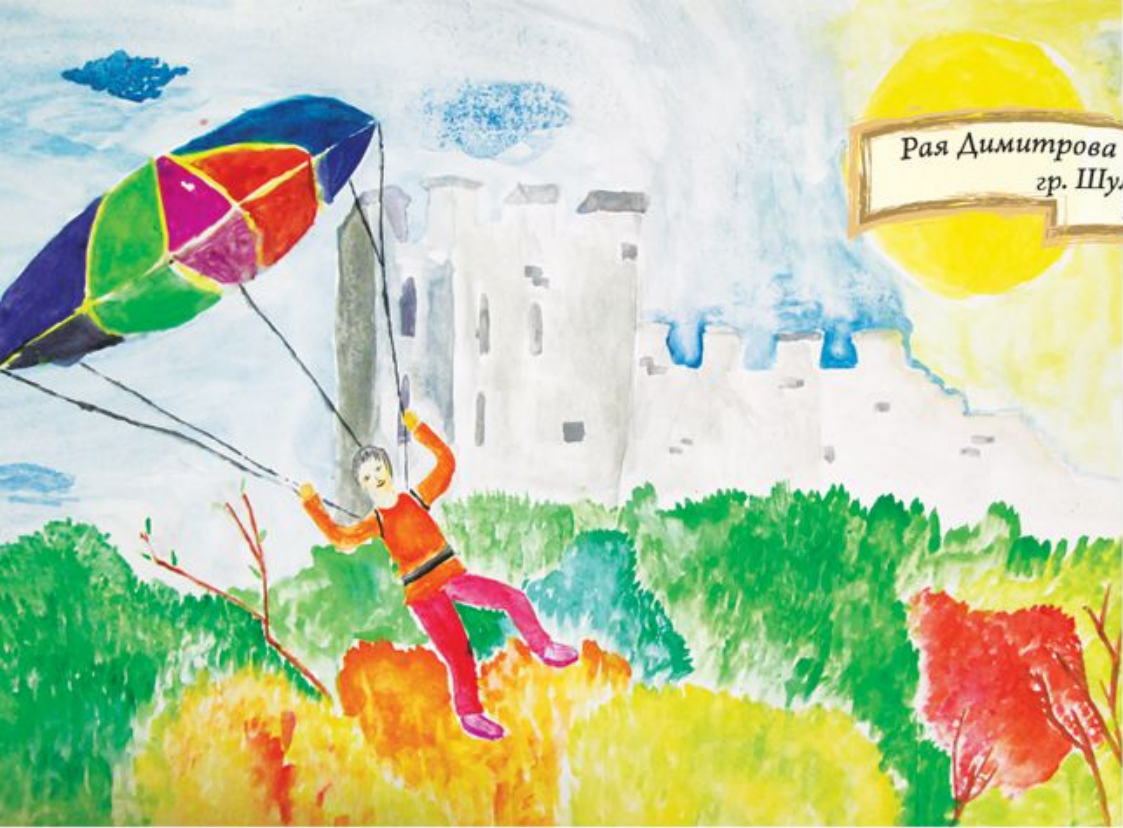
Рая Димитрова гр. Шумен 13 г.